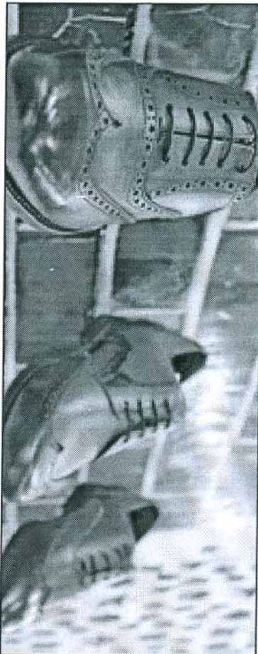
A number of workers in leather factories has come down by nearly 75% as they are not being paid on time

"There has been a significant decline in the arrival of animal hide. While tanneries in major leather clusters such as Agra, Kanpur and Kolkata have recorded more than 75% decline, Chennai recorded